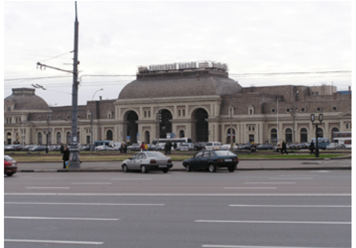
Bild 6: Paweletzkiy Bahnhof Direktverbindung zum Flughafen Domodedevo