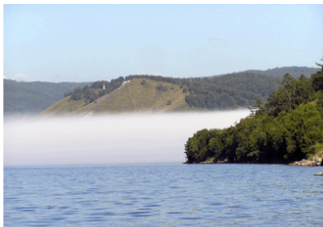
Morgennebel über der Angara bei Listwjanka