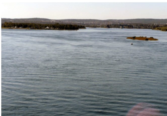
Mündung des Irkut in die Angara bei Irkutsk