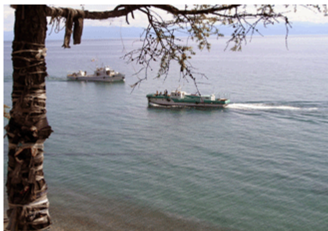
Ausflugsboote auf dem See