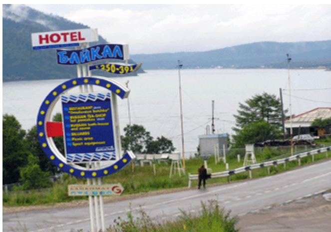
Angara bei Listwjanka mit Wegweiser zum Hotel Baikal

Sie war die Tochter des alten Baikal. Sie war jedoch in den großen Jenissej verliebt, zu dem sie eines Tages flüchtete. Aus Zorn warf Vater Baikal einen großen Stein nach ihr. Dieser so genannte „Schamanenstein“ ragt heute bei Listwjanka aus dem Wasser und bildet die Grenze zwischen Baikalsee und Angara.