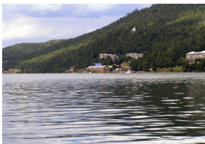
Flussufer der Angara