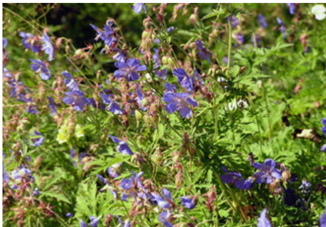
Blumen am Wegesrand