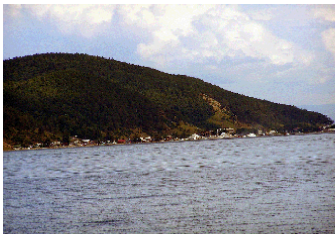
Flussufer der Angara

Die Angara ist 1779 Km lang und fließt nach Norden in den Jenissej. Die obere Angara entspringt ca. 300 Km nordöstlich des Baikalsees, fließt in den Baikal und bildet somit einen der 336 Zuflüsse zum See. Als (untere) Angara bildet der Fluss den einzigen Abfluss aus dem Baikalsee.