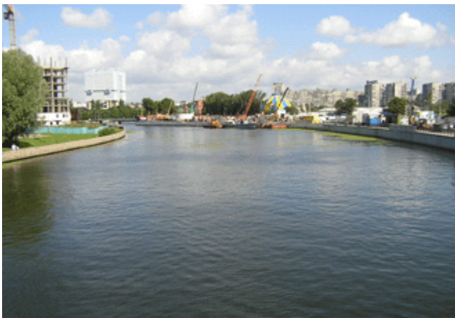
Blick zum späteren Fischerdorf (hier noch im Bau)