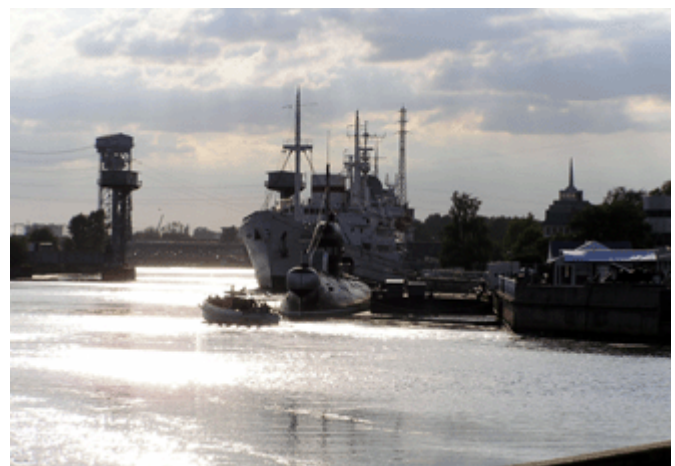
Blick auf den Hafen von Kaliningrad mit Museums-Komplex: Forschungsschiff „Witjas“, Diesel-U-Boot „U-413“ und Bahnverfolgungsschiff „Kosmonaut Pazajew“