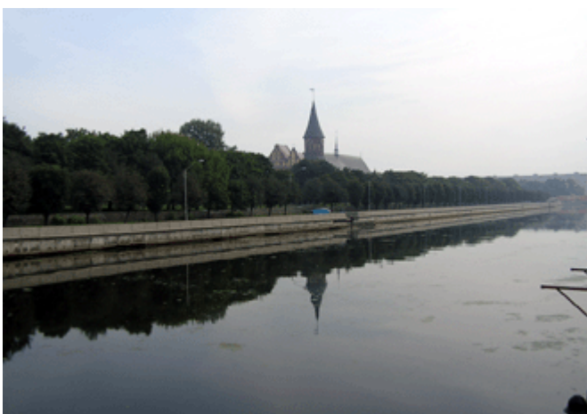
Blick über den Pregel auf die Dominsel

Nach der Kapitulation der deutschen Kommandantur und Eroberung durch die Rote Armee wurde Königsberg 1946 offiziell in Kaliningrad umbenannt.