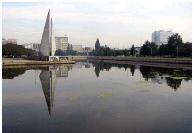
Blick über den Pregel mit Seefahrts-Denkmal