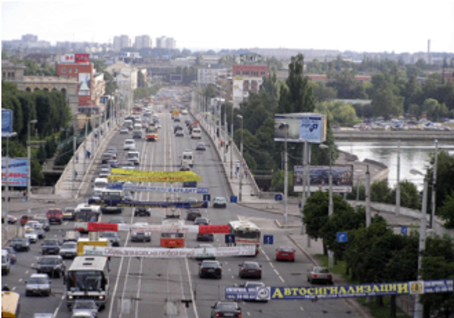
der Leninskiy Prospekt in gerader Linie zum Hauptbahnhof