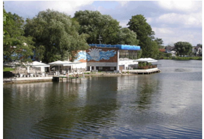
ein idyllisches Grillrestaurant am Oberteich