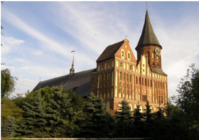
Der Königsberger Dom nach der Rekonstruktion

Um 1240 wurde Königsberg als Handelsstützpunkt der Ostsee-Hanse erwähnt. Zwischen 1330-1380 erfolgte der Bau des Königsberger Domes.