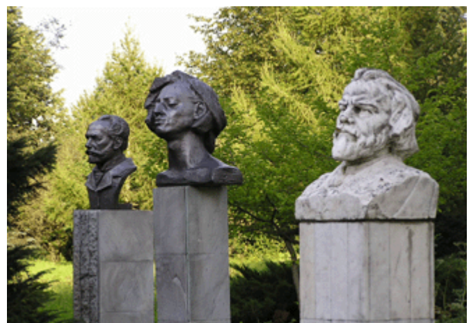
Steinbüsten im Park der Dominsel