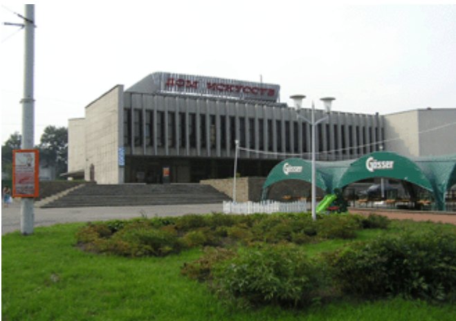
das Haus der Künste am Leninskiy Prospekt ehemaliges Kino „Oktober“ von 1975