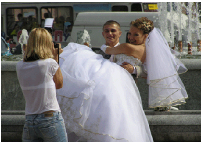
am Platz des Sieges treffen sich die Brautpaare

In der Zeit um 2007-2008 wurde im Zentrum am Pregel das neue „Fischerdorf“ erbaut.