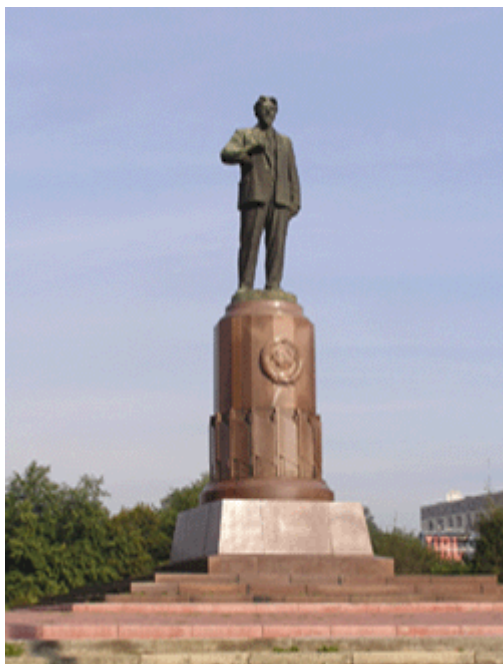
13-Meter hohes Kalinin-Denkmal von 1959, gegenüber Hauptbahnhof, Kalinin (1875-1946) war einer der treuesten Gefolgsleute Stalins, ihm zu Ehren wurde das zerstörte Königsberg in Kaliningrad umbenannt - obwohl er nie hier war!