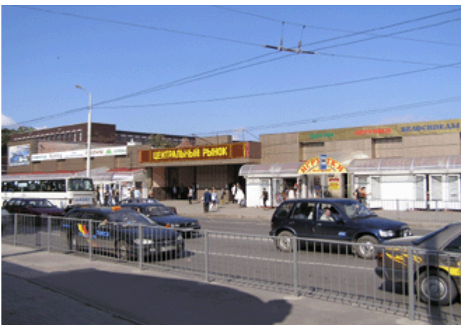
Der Zentralmarkt an der Uliza Chernjakhowskogo ist teils Bauernmarkt und teils Flohmarkt!