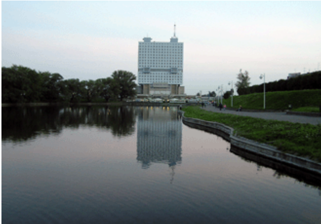
Die leerstehende Invest-Ruine „Haus der Räte“ auf dem Gelände des ehemaligen Schlosses

Seit den 50er Jahren war das Gebiet Königsberg militärisches Sperrgebiet und bis 1992 für Ausländer kaum zugänglich. Seit 1992 ist Kaliningrad wieder für Touristen und Ausländer geöffnet. Viele Russland-Deutsche aus Mittelasien zogen hierher, um sich eine neue Existenz aufzubauen.