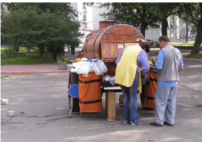
Mit etwas Glück findet man im Sommer noch einen echten Kwas-Wagen!