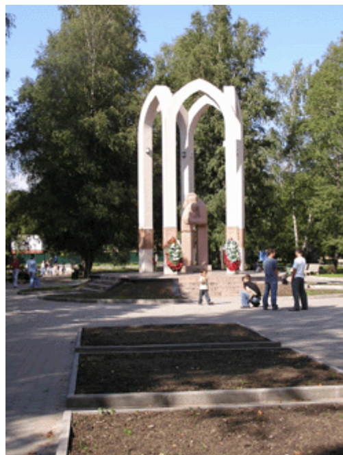
Denkmal für die in Afghanistan gefallenen Soldaten der Sowjetarmee