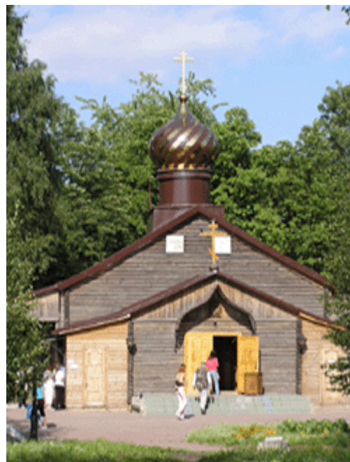
hölzerne Ausweich-Kirche während des Baus der Erlöserkirche