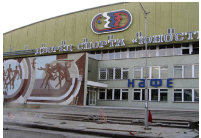
Haus der Jugend und Sport am Pregel