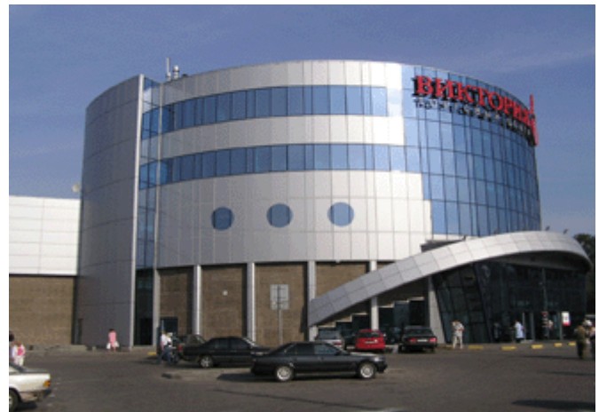
Megamarkt Viktoria (in Russland ist alles MEGA)