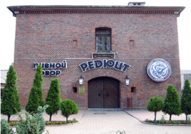
Bierhaus Redoute neben dem Königstor