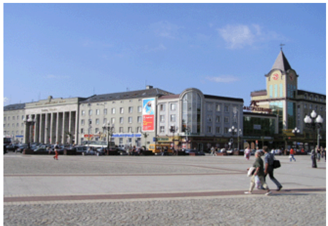
der alte Nordbahnhof