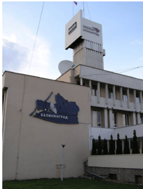
Zentrale der Kaliningrader „Telekom“