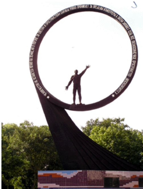
Denkmal von 1980 für die Kosmonauten aus dem Gebiet Kaliningrad (z.B. Alexej Leonov 1965)