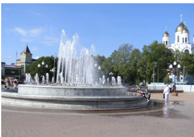
der Platz des Sieges am Nordbahnhof anlässlich der 750-Jahr-Feier 2005 neu gestaltet