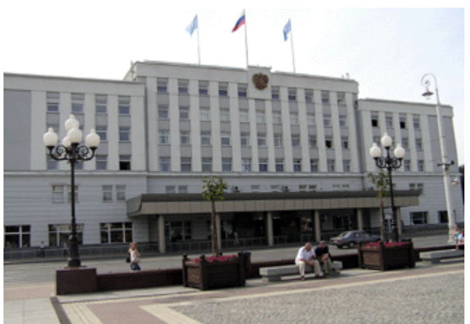
Stadtverwaltung am Platz des Sieges