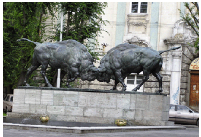
Brunnen „Kämpfende Wisente“ von 1912 Prospekt Mira