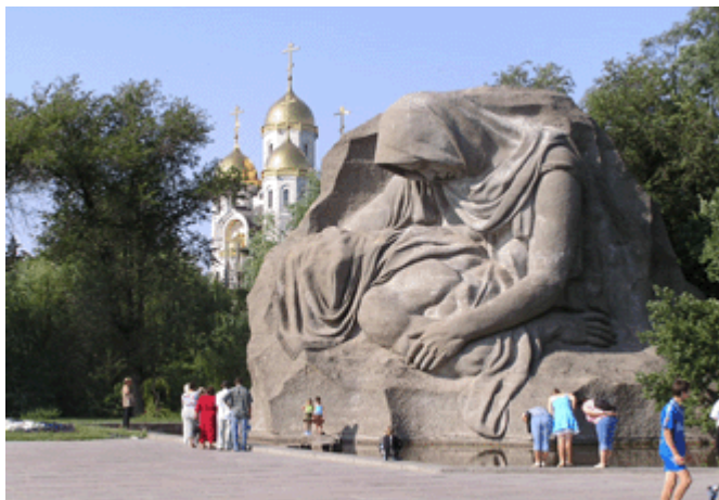
Denkmal der trauernden Mutter (mit neuer Kirche)