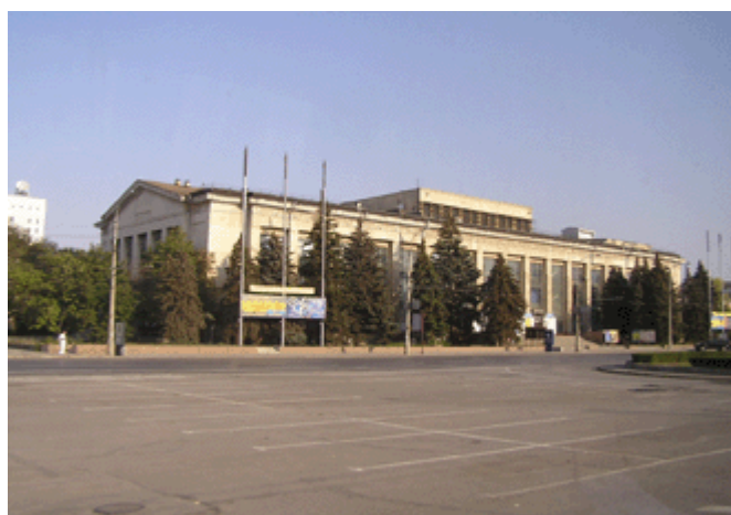
Neue Gebäude aus der Nachkriegszeit im Stadtbild von Wolgograd

In den Kämpfen des russischen Bürgerkriegs nach 1917 fanden hier schwere Kämpfe zwischen Rot- und Weißgardisten statt. Die Revolutionsgeneräle Stalin und Woroschilow errangen hier große Siege gegen die Weißgardisten. 1925 wurde die Stadt zu Ehren Stalins in Stalingrad umbenannt und genoss eine besondere Förderung durch den Namens-Paten.