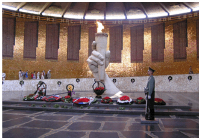
die „Halle des Ruhms“ mit der ewigen Flamme