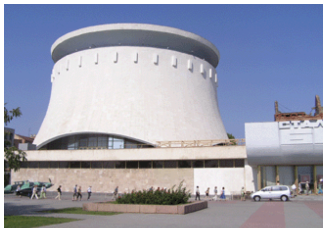
das Panorama-Museum über die Schlacht