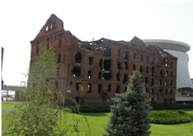
Die Kriegsrueine „Rote Mühle“ im Zentrum

Im Zentrum der Stadt entstand ein weiteres Denkmal zu Ehren der Schlacht um Stalingrad. Hier befindet sich das Rund-Panorama-Museum mit Schlacht-Dioramen neben der durch die Kämpfe zerstörten „Roten Mühle“. Die „Rote Mühle“ wurde von deutschen und sowjetischen Truppen hart umkämpft und zerstört. Zum Gedenken an die Kämpfe wurde die Mühle als Ruine für die Nachwelt erhalten.