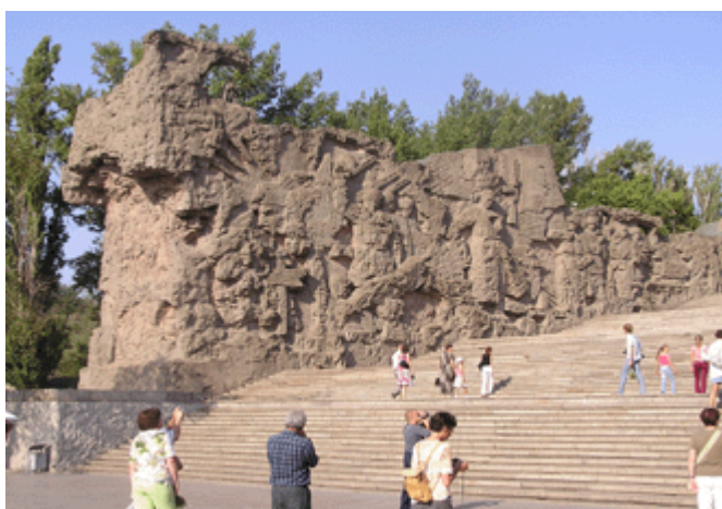
In Stein und Beton gefertigte Schlachtszenen