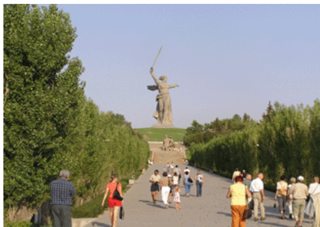
Beginn der Allee zum Mamajew-Hügel

Mit dem Mamajew-Kurgan entstand auf einem der stark umkämpften Hügel eines der größten Kriegsdenkmäler der Welt. Die Gedenkstätte wurde 1962 eröffnet und umfasst ein Areal von über 200 Hektar. Sie ist den sowjetischen Soldaten sowie den tapferen Zivilisten, Partisanen und Müttern gewidmet. Der Hügel wird gekrönt von der Riesenfigur der „Mutter Heimat“ (85 Meter hoch und ca. 8000 Tonnen schwer).