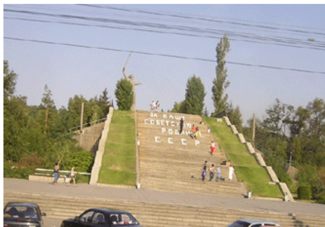
Aufgang zum Mamajew-Kurgan

Aber auch viele Soldaten der Roten Armee ließen ihr Leben in und um Stalingrad. Diese Schlacht brachte die Wende des 2. Weltkrieges und leitete den Rückzug der deutschen Wehrmacht bis nach Berlin ein. Die Stadt wurde durch die Kämpfe vollständig zerstört und musste nach dem Krieg völlig neu aufgebaut werden. Die ganze Stadt ist von der Architektur der 50er und 60er Jahre geprägt.