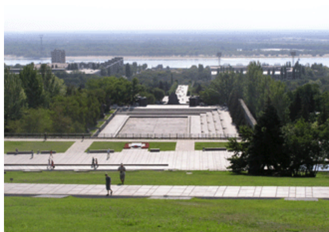
Blick vom Mamajew-Kurgan zur Wolga

Etwas 30 Km von Wolgograd entfernt entstand bei Rossoschka der zentrale Sammelfriedhof für die an der Wolga gefallenen deutschen Soldaten.