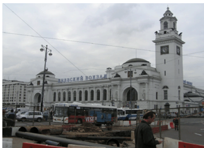
Bild 7: Kiewer Bahnhof / Züge Richtung Süden Direktverbindung zum Flughafen Vnukovo