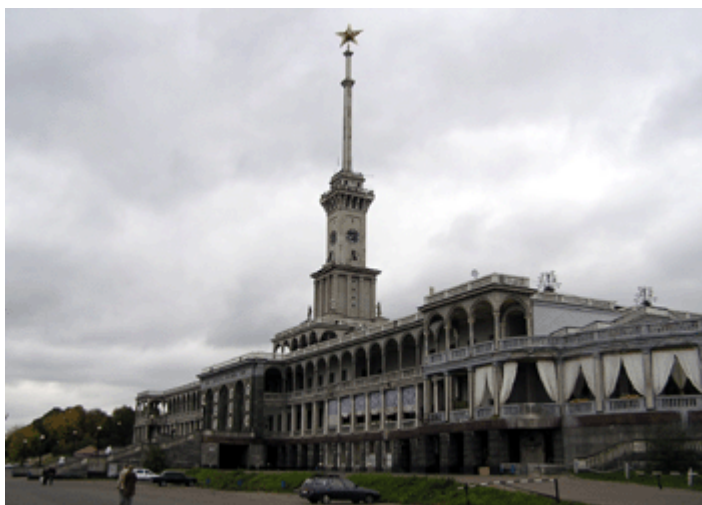
Bild 24+25: Nördlicher Flusshafen an der Metro-Station „Rechnoi Voksal“