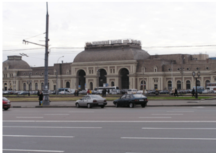
Bild 6: Paweletzkiy Bahnhof Direktverbindung zum Flughafen Domodedevo