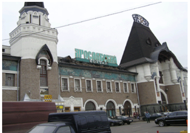
Bild 2: Jaroslawler Bahnhof Start und Ziel der Transsibirischen Bahnen