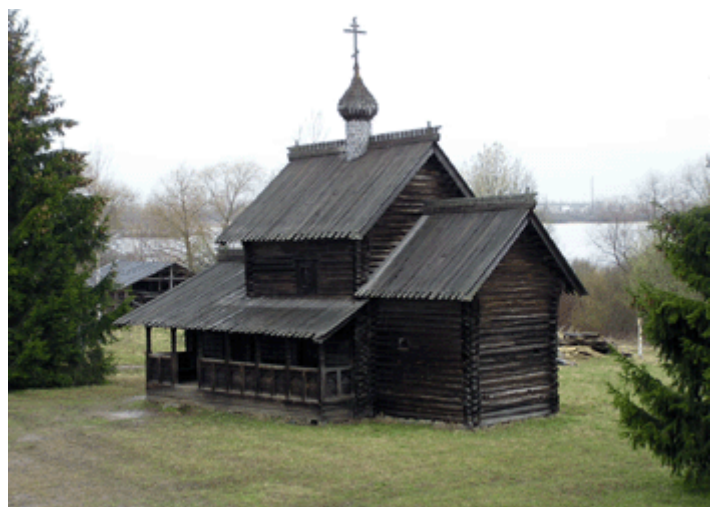
Bild 3 + 4: Holzkirchen und Bauernhäuser wurden, zum Teil aus anderen Landesteilen, hierher gebracht und in diesem Freilichtmuseum aufgebaut. Im Sommer und Winter finden auf dem Gelände Volksfeste statt.

Gegenüber dem Freilichtmuseum wurde ein privates Hotel errichtet. Besonders im Sommer ist die Region ein reizvolles Ausflugsziel.