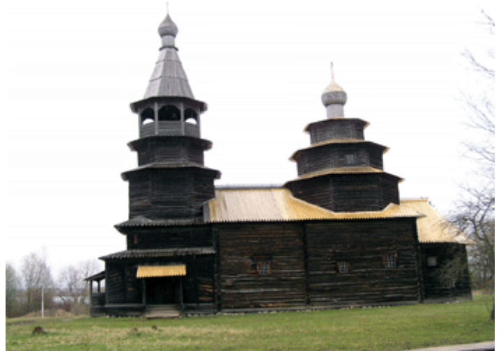
Bild 1 + 2: Architektur-Freilichtmuseum „Vitoslavlitzky“ in der Nähe von Novgorod