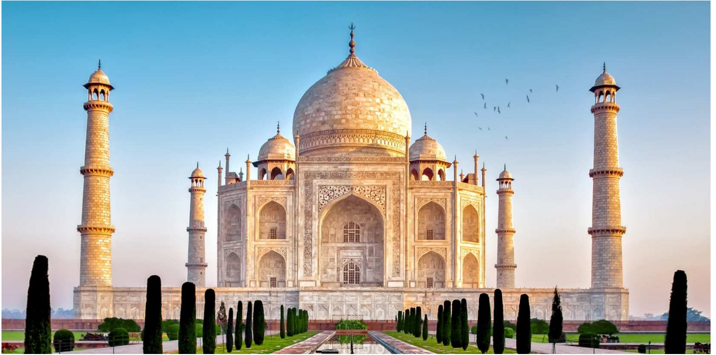
Taj Mahal, Agra