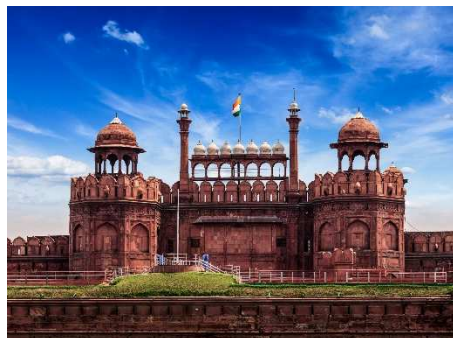
Rotes Fort, Delhi