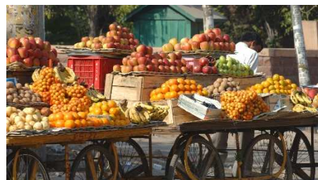
Marktstadt, Indischer Bazar

Diese Reise ist ein Teil der Reisebausteine Goldenes Dreieck, Nordindien und Nordindien-Nepal mit ggfs. wechselnder Teilnehmerzahl.