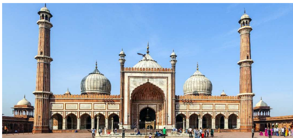
Jama Masjid Moschee, Delhi