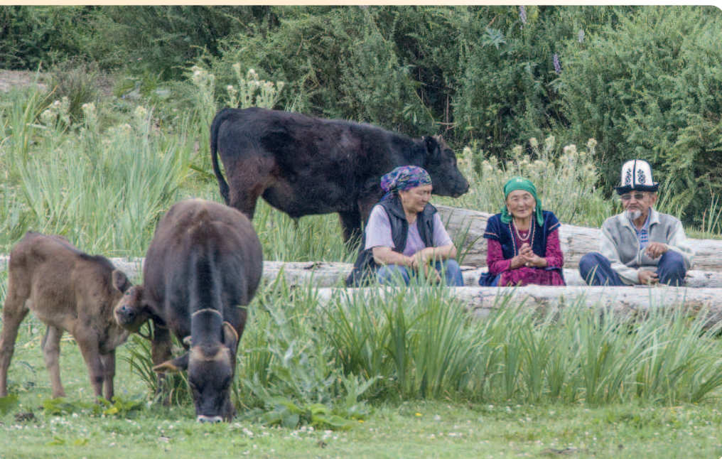
Nomadenfamilie beim Issyk-Kul See in Kirgistan

Vom großen Basar in Osh zur grünen Metropole Almaty.