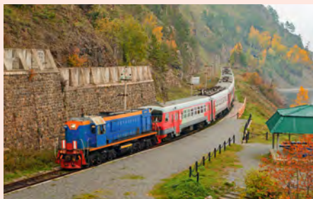
Sie fahren im Sonderwagen, der an Linienzüge der Russischen Bahn angehängt wird. Details finden Sie unten.

„Das Wort Sibir steht im Tatarischen für schlafendes Land. Im Mongolischen bedeutet es so viel wie Waldesdickicht.“