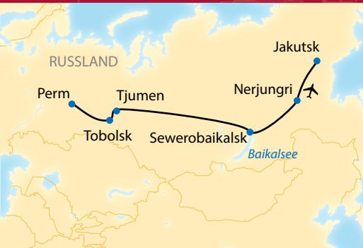
Transsib-Linienzug am Baikalsee

14-tägige Zug-Erlebnisreise auf außergewöhnlicher Route im Sonderwagen durch Sibirien