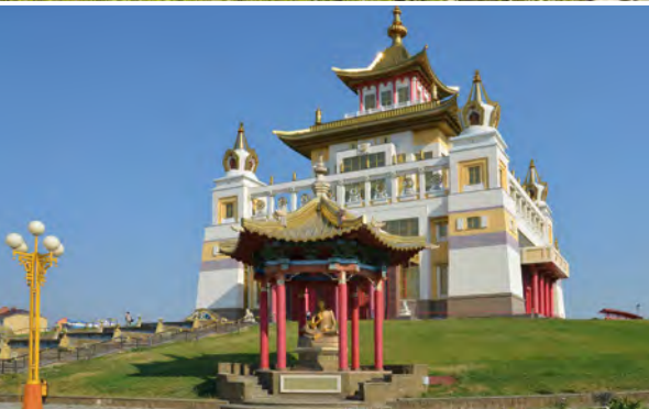
Goldener Tempel in Elista