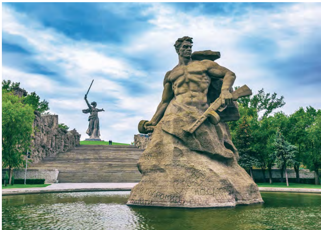
Denkmal-Ensemble mit der Mutter-Heimat-Statue in Wolgograd

„Die 180.000 Kalmücken sind das einzige buddhistische mongolisch-sprachige Volk Europas und leben in ihrer eigenen Republik.“